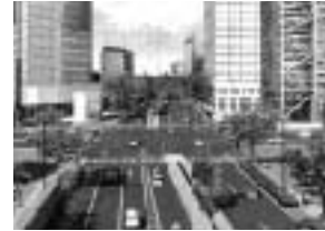
中野坂上近辺の完成予想図

山手通り拡幅整備事業に伴い、中野坂上近辺の歩道部に風除け効果を高めるため、ケヤキを約10m間隔で植え、その間に生垣が植栽されます。完成は平成22年度予定。