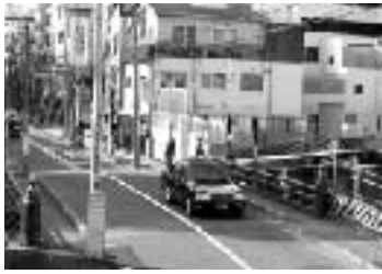
現在工事中の神田川と新橋

地下鉄丸ノ内線中野新橋駅に程近い神田川に架かる「新橋」の架け替え工事が順調に進んでいます。