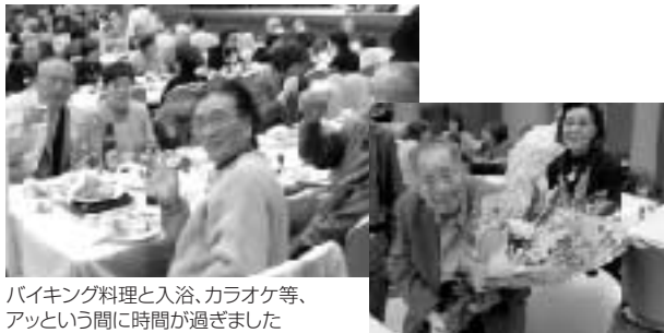
バイキング料理と入浴、カラオケ等、アツという間に時間が過ぎました

多数の方の参加のもと3月7日、「日帰り懇親会」が行われました。大谷観音見学のあと、鬼怒川温泉「あさやホテル」で昼食・中国雑技団ショー・入浴など、皆さんと楽しい一日を過ごしました。