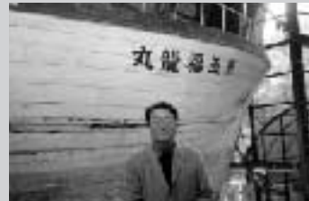
町会のバスツアーに参加。 昭和29年にビキニ環礁でアメリカが行った水爆実験で被爆した今でも保存されている「第五福丸丸」を見学。当時のビキニ水爆報道の写真を見て驚愕。有意義な1日になりました。 (3月28日実施)