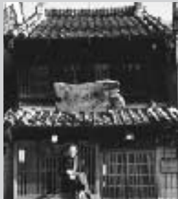
町会バスツアーに参加。 千葉県佐原に今も残る昔の木造建築を見学 (2月21日実施)

弥生地区青少年育成部主催によるミニリーダの会に環境部も出席。子供達と町を歩き、感じるままに写真を撮って、その後に各グループが発表、子供の発想・創造のすばらしさに改めて関心 (3月6日・弥生地域センター)