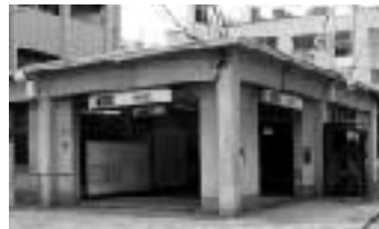
昭和39年頃に建てられたままの中野新橋駅

区内で唯一バリアフリー化が遅れている(24年度完成予定)中野新橋駅について、その後の進捗状態を尋ねました。区は「新たな用地買収取得に目途がついたので、現在、計画全体の見直しを図っている。今後とも早期完成に向けて東京メトロに要請していく」と回答しました。