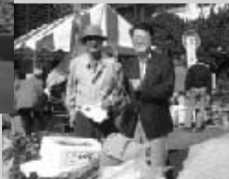
「中野まつり」で伊豆直送の大きなわさびを購入、晴天にも恵まれ区民参加のもと大きな賑わいでした (10月・サンブラザ前)