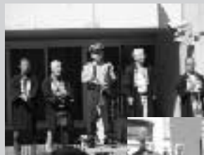
四町会の神輿が中野警察前に勢揃い。署長の拍子木が響く中、祭りも最高潮 (9月・中野警察署前)