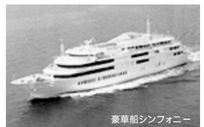
豪華船シンフォニー

バスの車窓から都内を巡り、六本木ヒルズ展望台から東京の景観を一望に。昼食は西麻布・香港ガーデンの飲茶食べ放題。その後、昭和30年代を再現した台場の商店街で古き良き時代をふりかえって頂きます。ラストは豪華船シンフォニーで東京湾クルーズしながらお茶とケーキを! 皆さまと、楽しい一日を過ごしたいと思います。