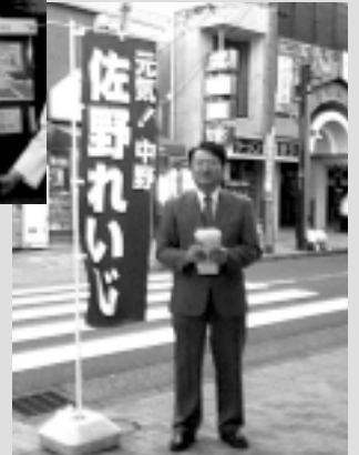
街頭でなかの夢とぴあ4号を配布する(中野新橋駅前にて)