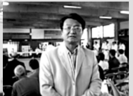
柔道部OBとして新人戦の応援にかけつける(武蔵大学にて)