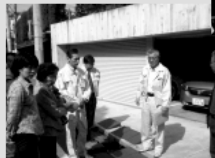
住民から陳情を受け現場で排水溝の流れの改善策を図る(中野区中央にて)