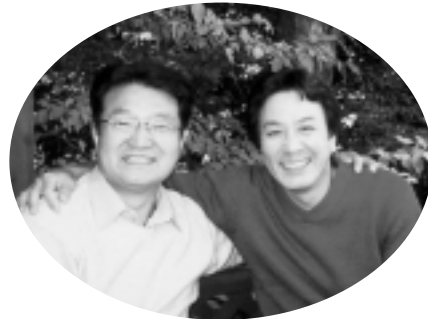
俳優 田村 亮 (たむら りょう)

二人の少年が始めて出会ったのは成城学園中学一年の時でした。それから中高六年間を共に過ごし、以後それぞれの道を歩み始めて早四十年、私は俳優に、佐野は中野区議となり、今でも家族ぐるみで付き合っています。 友情とは有難いもので、彼は私の舞台のたびに駆けつけてくれます。六本木のスイートベイジルで行った五月のライブ『民話の調べ2005』にも来てくれました。その折、彼は自分が出している新聞を示し、私に原稿を書けと言う。五月三十日からTBS系でスタートしたドラマ『ヤク・ソク』の収録に追われていると言っても彼は聞いてくれません。学生時