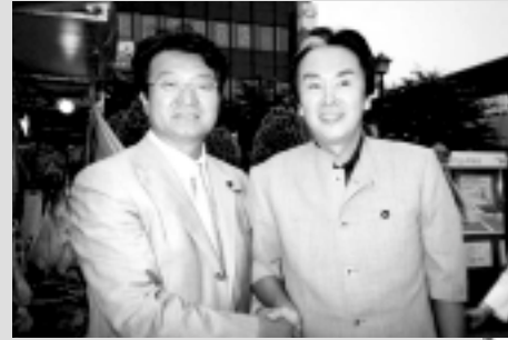
以前より私を支援してくださる石原伸晃氏と一緒に(中野駅前にて)