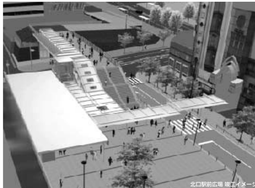
北口駅前広場 竣工イメージ

昨年来工事が続いていた中野駅北口駅前広場とその周辺整備が6月末に完了し、7月1日から供用開始されました。 中野四季の都市(旧警察大学校等跡地)を筆頭に、いよいよ未来の姿が見えてきた中野駅周辺まちづくりの近況とこれからの展望についてご報告します。