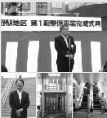
中野駅北口に架かる歩道橋(東西連絡路)の中野区主催の開設式典が歩道橋上で行われた。この歩道橋は中野通りを横断するもので、エレベーター、エスカレーターも設置されている。当日私も区議として参加した(7月1日)