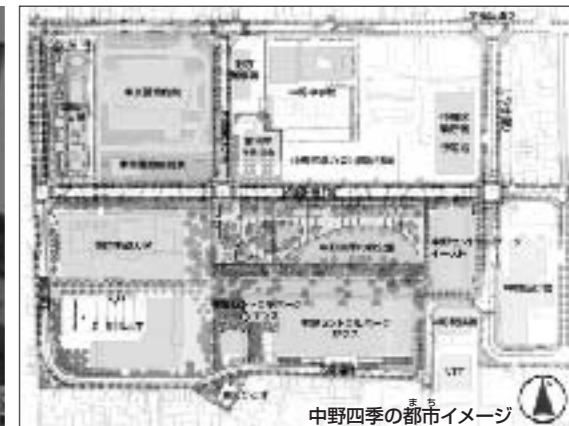
中野四季の都市イメージ