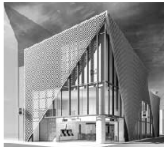
◀中野新橋駅の新駅舎外観イメージ図 地上3階、地下2階、高さ13.6m 正面がガラス張りになっている