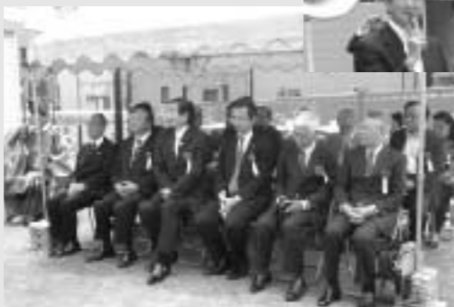
「なかしん広場」(約70坪)の開設記念式典が地元の道玄町会主催により、神田川に架かる中野新橋のたもとで行われた。当日私は地元町民として司会を担当し近隣の町会長や区・都関係者も来賓として参加し、安全祈願を全員で行った。(6月3日)