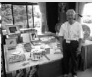
「中野区伝統工芸展」が今年も開催され区内在住の匠の実演と即売会が行われた。伝統的な匠の技を是非とも次の世代に続けて欲しいものである。(6月1日)