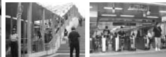
▲新設された歩道橋