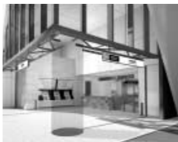
▲1階の切符売り場、改札イメージ図 明るく、広いスペースがとれている